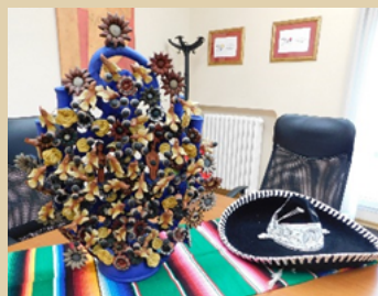
Детаљи из Амбасаде Мексика