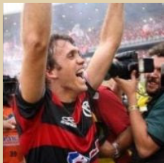
Дејан Петковић Рамбо