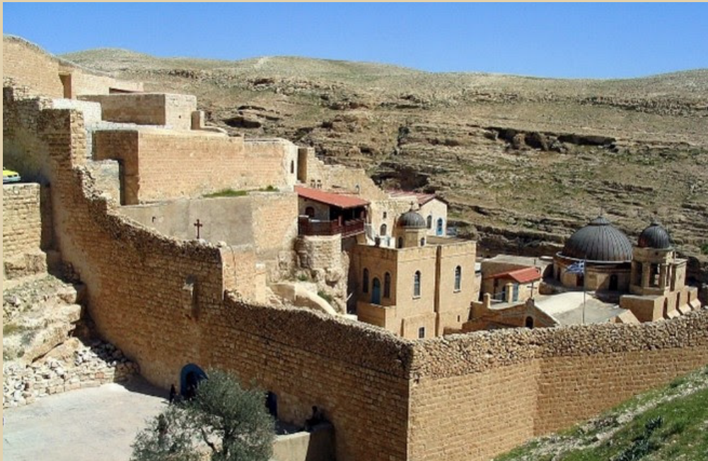
Манастир Светог Саве Освећеног у Држави Палестини

Враћајући се на саме почетке односа Србије и Палестине, подсетио је да је још Свети Сава боравио у овој земљи. Народ га је ту прихватио као принца и духовног вођу. Најстарији манастир у Палестини носи његово име – манастир Светог Саве Освећеног, или Мар Саба.