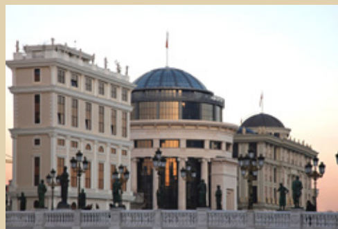
Скопље, главни град Северне Македоније

Током историје, данашње државе Северна Македонија и Србија биле су повезане на различите начине. Средњовековна Србија управљала је областима које данас обухвата Северна Македонија, а за време заједничког живота под окриљем СФРЈ изграђене су инфраструктурне и економске везе које и данас значајно доприносе привредној размени и регионалној повезаности. Данас су обе земље део иницијативе Отворени Балкан, која је великог значаја за регионални економски развој и процес њиховог прикључења Европској унији.