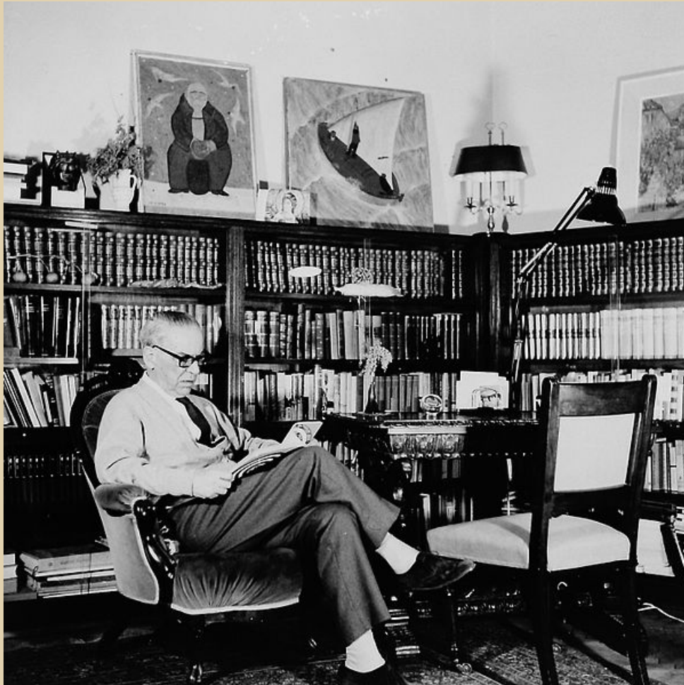
Иво Андрић у својој радној соби

„Не само да дипломатија није за свакога, него се може слободно рећи да је мали број људи који заиста имају дара и звања за тај посао. То су људи добре али једноставне памети, људи упрошћене и ограничене осетљивости и хладна срца, али не и лишени срца и без сваке осетљивости, способни за претварање, али не затворени и тајанствени, још мање подли, снажни, али не и груби, брзи и одлучни, али не преки и брзоплети, стварни, трезвени, али и суви и досадни”, записао је Иво Андрић у својој бележници о дипломатама.