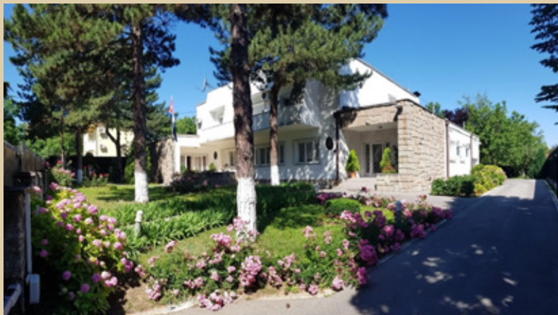
Непокретност из фонда Дипос-а, коју амбасада Кубе користи за потребе амбасаде и резиденције