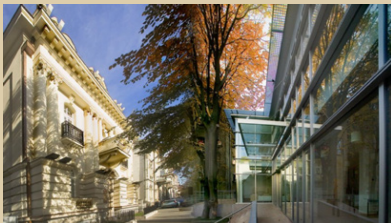
Кнеза Милоша бр. 56 - непокретност из фонда Дипос-а, коју амбасада Републике Италије у Београду користи за пебе свог Института за културу у Београда