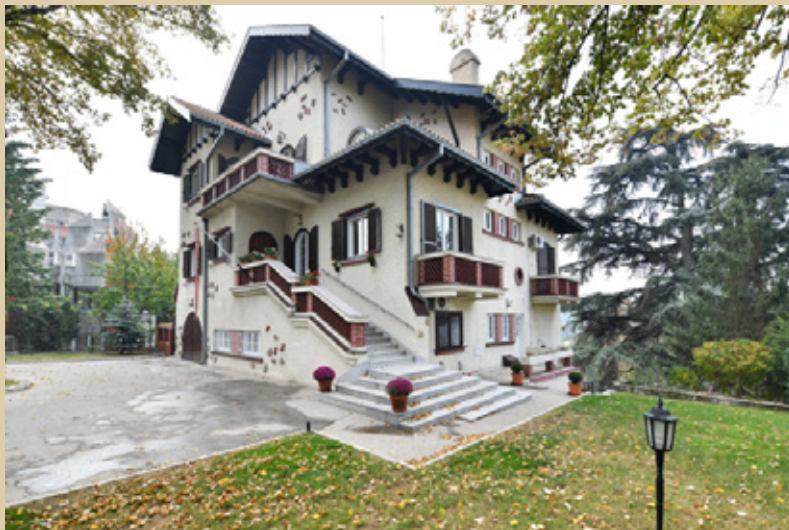
Непокретност из фонда Дипос-а, коју амбасада Данске користи за резиденцијалне потребе