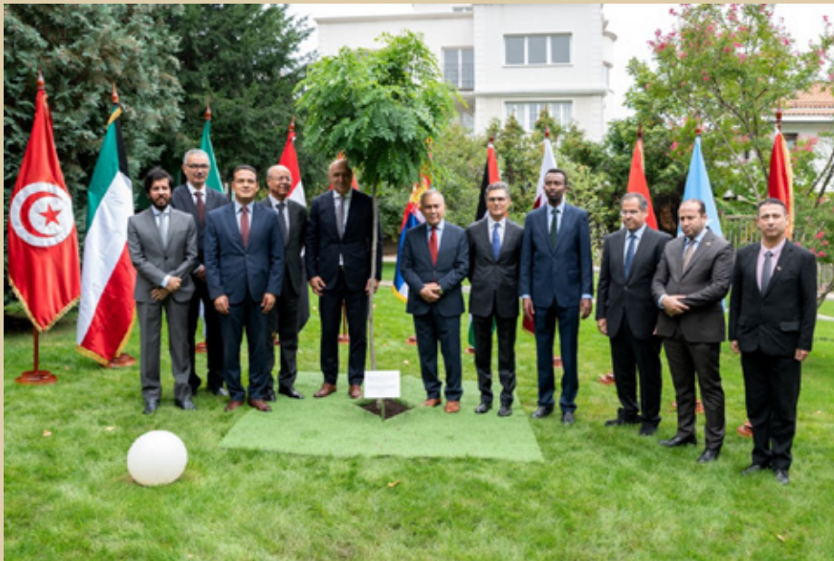
Директор Дипос-а и амбасадори арапских земаља у Београду: Државе Палестине, Краљевине Мароко, Државе Катар, Арапске Републике Египат, Државе Либије, Народне Демократске Републике Алжир, Савезне Републике Сомалије, Државе Кувајт, Сиријске Арапске Републике, Републике Тунис.

Захваљујемо се свим нашим драгим пријатељима што су својим присуством допринели да овај догађај буде један посебан и величанствен дан за Дипос.